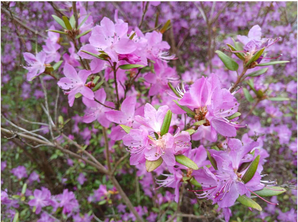
Rhododendron ledebourii