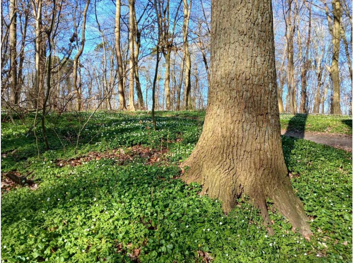
Buschwindröschenblüte im Park Devin, Foto: Angela Pfennig