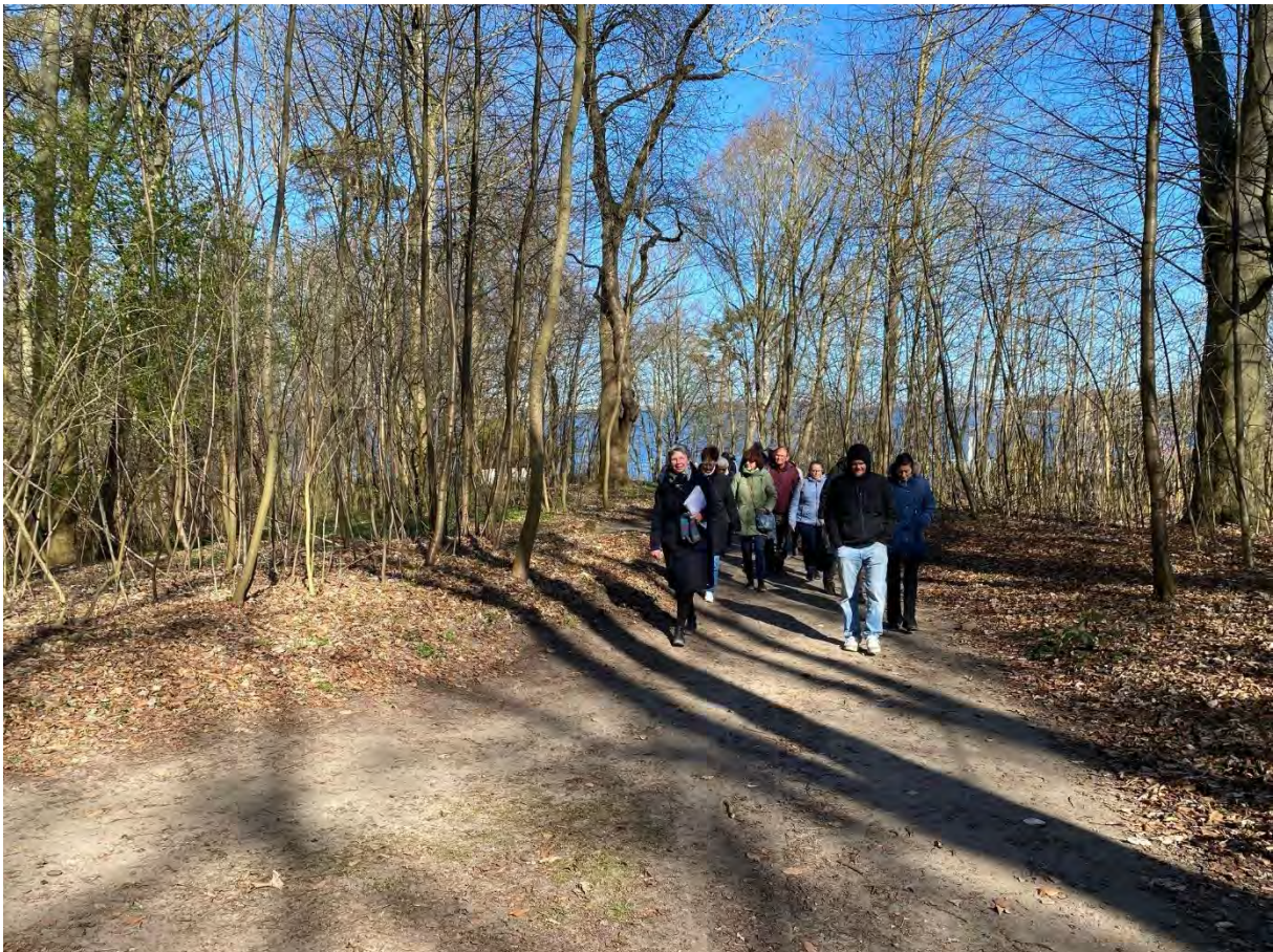
Frühlingsspaziergang im Deviner Park, Fotos: Petra Rackow