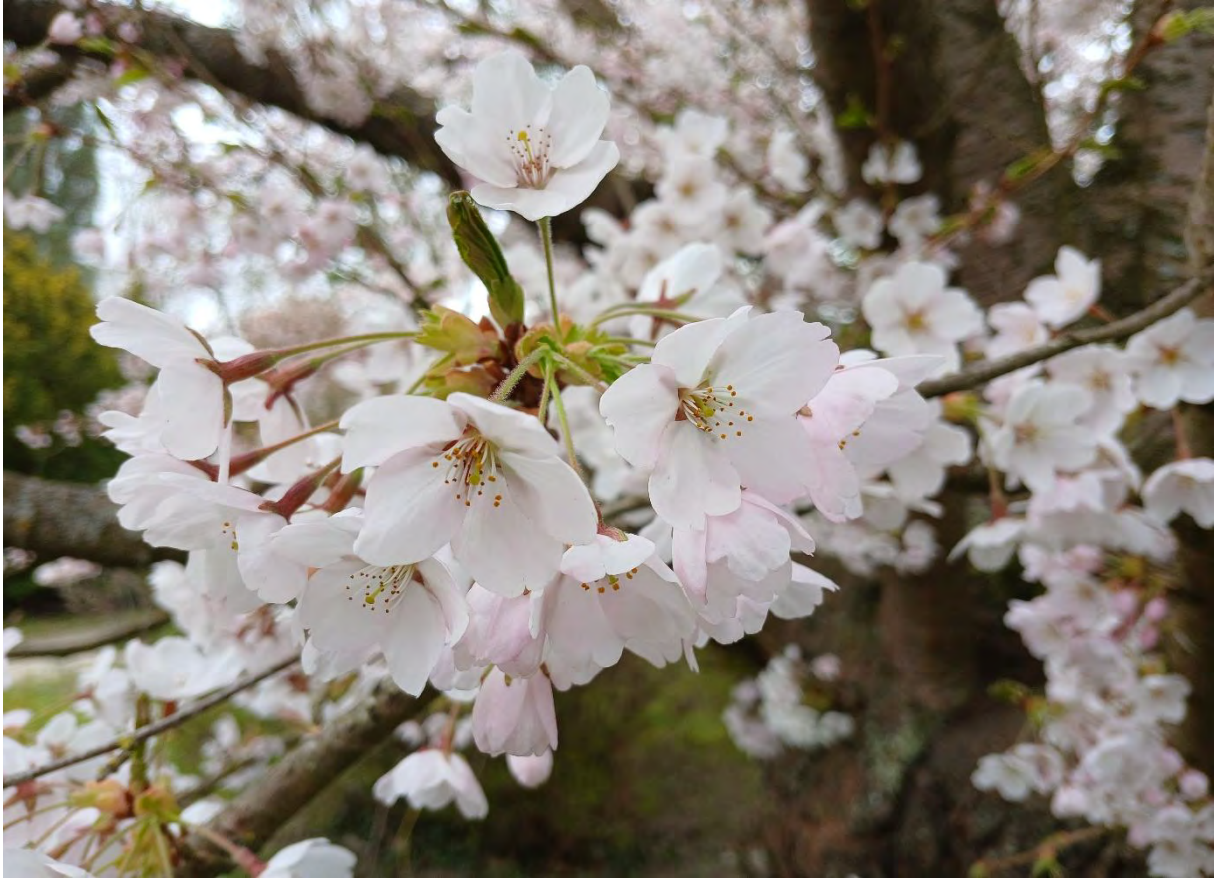
Prunus x yedoensis