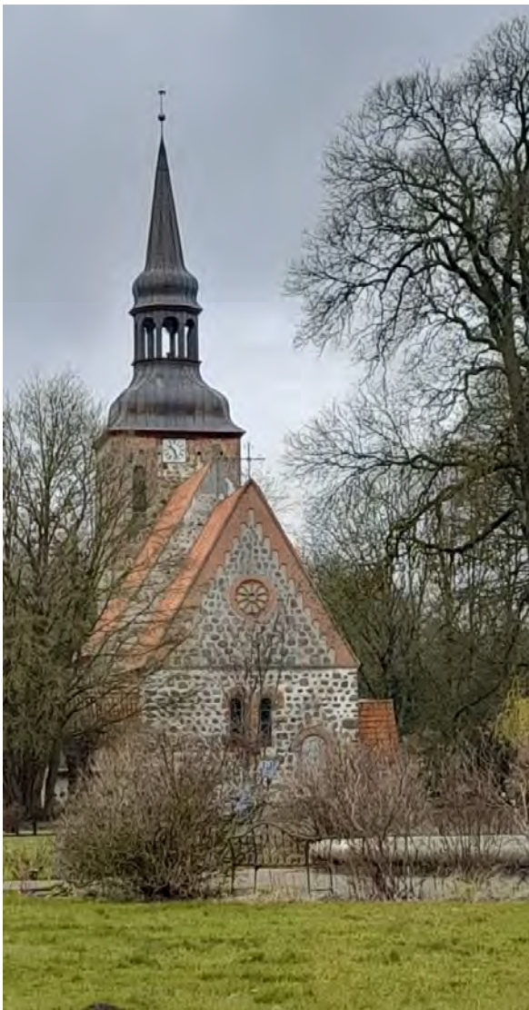
Dorfkirche Semlow

Die zu Beginn des 13. Jahrhunderts während der Regierungszeit des Bischofs Brunward (1192-1238) als Feldsteinbau errichtete Kirche ist wahrscheinlich die älteste auf dem Festland des ehemaligen Fürstentums Rügen. Mit dem Bau des Chores war vermutlich um 1190 begonnen worden, nachdem unter Heinrich dem Löwen (um 1129/30 oder 1133/35-1195) die ehemaligen slawischen Siedlungen der Region unterworfen worden waren. Vollendet wurde die Kirche um 1220. An der Westseite des Turmes ist ein großer Inschriftstein eingelassen, der auf die Erneuerung der Kirche im 19. Jahrhundert durch Ulrich Graf von Behr-Negendank (1826-1902) hinweist, mit dessen Familie die Geschichte der Kirche eng verbunden ist.