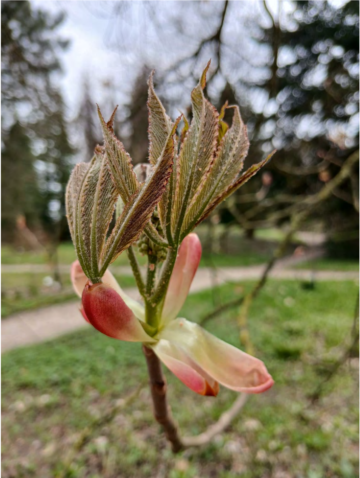
Aesculus x hybrida DC

Staunend und voller Freude folgten die Teilnehmer am Frühlingsbotanik Kurs im Arboretum Greifswald den begeisternden Ausführungen von Dr. Sabrina Rilke. Ihr Anliegen, Sehen zu lernen, vertritt sie mit Leidenschaft. Mit bloßem Auge, aber auch mit Lupe entdeckten wir die Wunder der Blüten, widmeten uns besonders den Hahnenfußgewächsen und würdigten den Vermehrungskünstler Scharbockskraut.