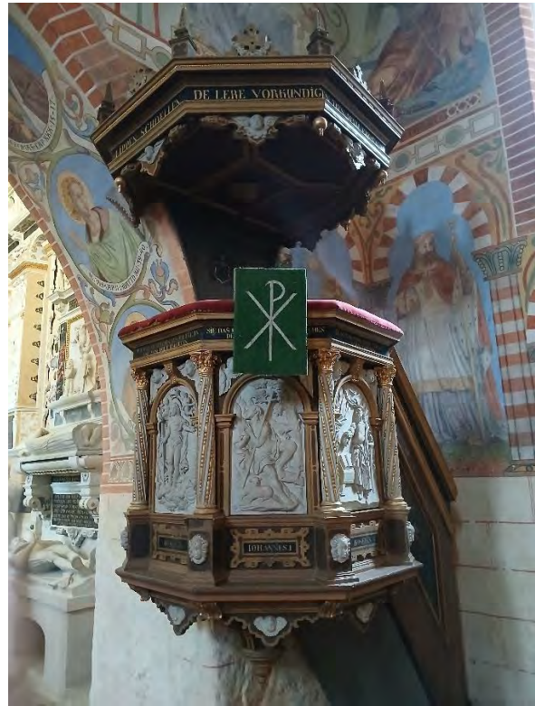
Holztaufe und Kanzel

Die Orgel mit schlichtem, dreiteiligem Prospekt wurde 1913 durch Karl Barnim Theodor Grüneberg (1828-1907) erbaut und 1999 wiederhergestellt.