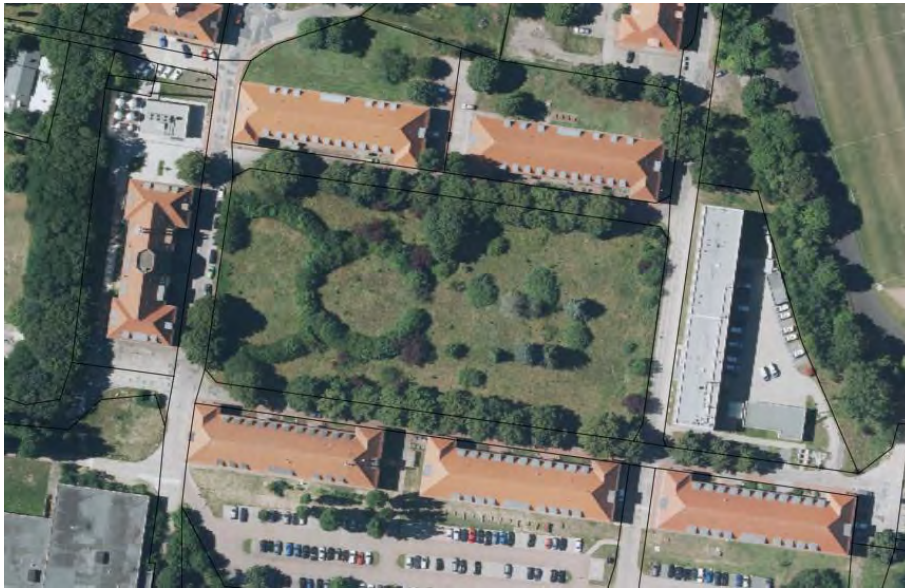
Park auf dem ehemaligen Exerzierplatz, 2015, Untere Denkmalschutzbehörde Stralsund