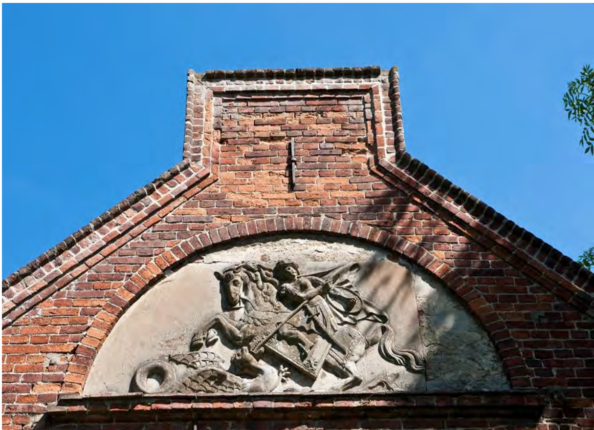
Giebel des ehemaligen Prävennerhauses mit Darstellung des Heiligen Georg, 2013, Foto: Jörn Lehmann

Der Frühlingsspaziergang führte vom Klosterhof über den ehemaligen Provisoratsgarten zu den früheren Prävennergärten, die derzeit neu entstehen, zu den Obstwiesen sowie in den einstigen Tannenkamp, der um 1835 zu einer landschaftlichen Parkanlage umgestaltet wurde. Zum Abschluss besichtigten wir das Relief mit der Darstellung des Heiligen Georg im Giebel des Langhauses, das aus der Werkstatt des Stralsunder Bildhauers Christoph Nathanael Freese stammt.