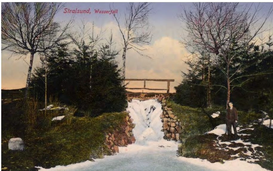
Wasserfall im Stadtwald, um 1910, Postkarte