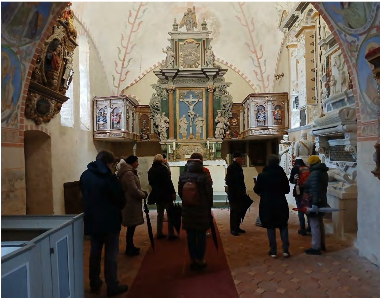
Chor und Altar

Die in 15 Felder gegliederte Decke zeigt des weiteren Jesus als Weltenrichter auf einem Regenbogen sitzend, umgeben von vier Evangelistensymbolen, sowie Engel. Heute ist die Decke der Semlower Kirche das noch am besten erhaltene Beispiel der Mildeschen Handschrift. An ihr wird sein handwerkliches Können in der Darstellung von Inkarnaten und Gewandfalten ebenso deutlich wie seine Anlehnung an italienische Fresken.