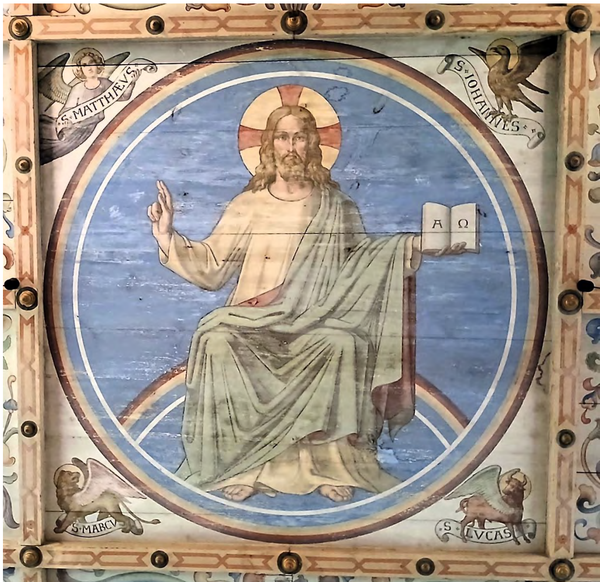
Kirche Semlow, Majestas Domini, Deckenmalerei von Julius Milde, um 1861, Foto: Angela Pfennig

Milde verwandte klare, helle Lokalfarben, so dass keine „trügerischen Schatten“ entstehen konnten. Sehr schön zu sehen in dem Antlitz eines Engels an der Nordwand, aber auch in der einzigartigen, kraftvollen Darstellung des Erzengels Michael. Michael, dem es aufgetragen ist, den Drachen, den Dämon in uns zu besiegen - durch Geisteskraft. Nicht militärische Stärke spricht aus der Haltung wie er den Speer gegen den Drachen richtet, sondern geistige, erdzugewandte Schönheit. Einem Ruder gleicht der Speer, den er fest in der Hand hat, keinem Tötungsinstrument. In seiner Bewusstheit und Reinheit weiß Michael ganz genau, wie er der Gefahr begegnen muss, damit der Drache ihm nicht, wie der Schwanz es bereits andeutet, seine Flügel stützt.