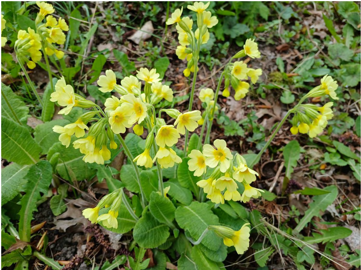
Himmelschlüsselchen im Arboretum Greifswald