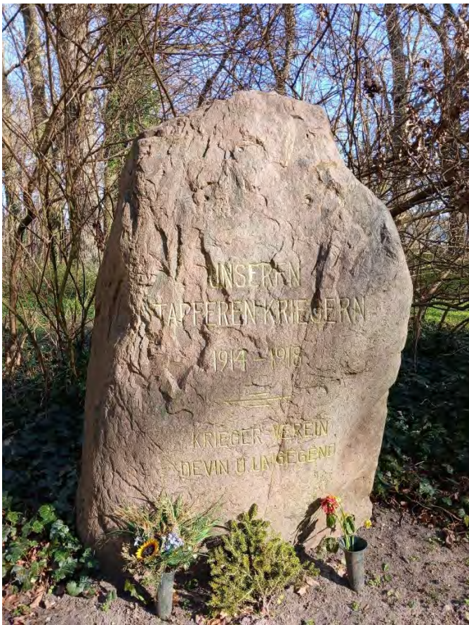
Gedenkstein für Gefallene des Ersten Weltkrieges, Foto: Angela Pfennig