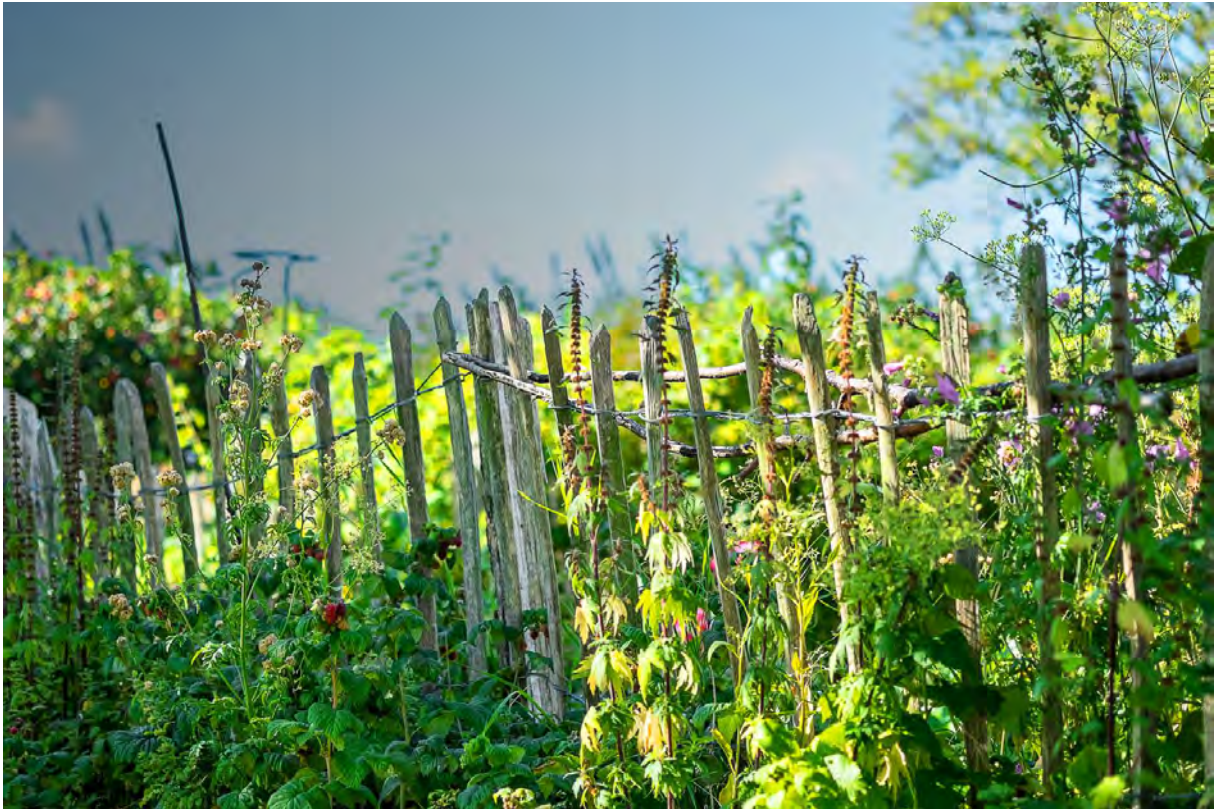
Garten in Neu Reddevitz, Foto: Holger Kummerow

Bitte informieren Sie sich über die Veranstaltungen auch unter http://www.stralsunder-akademie.de/aktuell.html