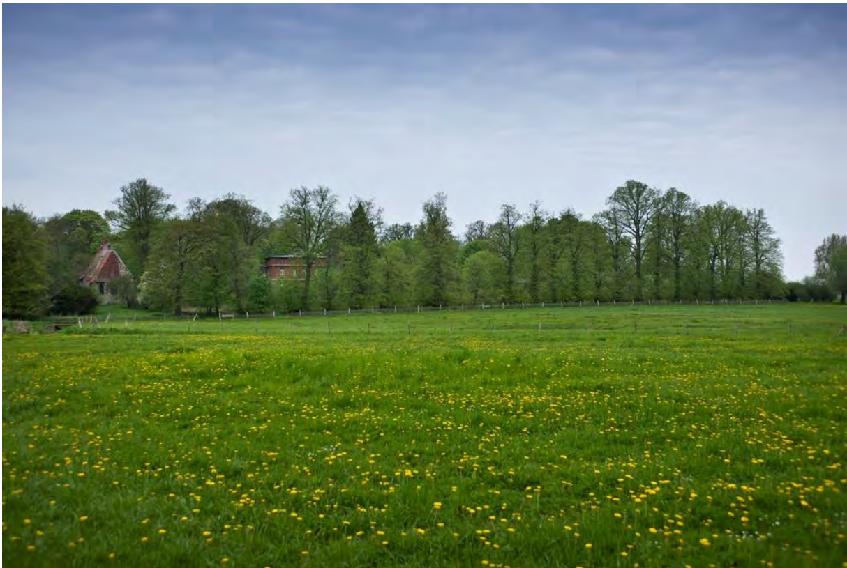
Kloster St. Jürgen vor Ramin von Osten, 2013, Foto: Jörn Lehmann

Die meisten Reisenden fahren jedoch vorbei, ohne dieses Gartenkunstwerk wahrzunehmen. Mir ist es auch jahrelang so ergangen, bis ich die Gelegenheit erhielt, mich näher mit der Geschichte der Klostergärten von Ramin zu beschäftigen, mich einzulassen und hierbei etwas vom einzigartigen Wesen dieses Ortes auf mich übergang; eine Faszination, ein Zauber, eine Berührung, die wohl nur Anlagen mit der Kraft einer langen gärtnerischen Tradition ausstrahlen können, die so ganz unabhängig ist vom Wandel der Zeiten.