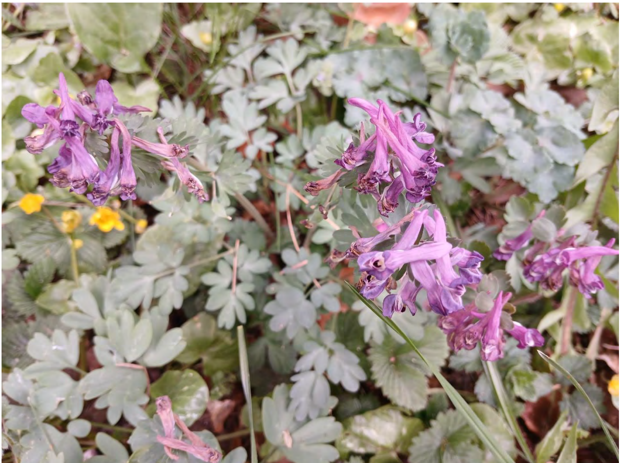
Corydalis solida