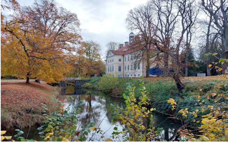
Barockpark und Schloss Griebenow, Foto: Gernot Hübner