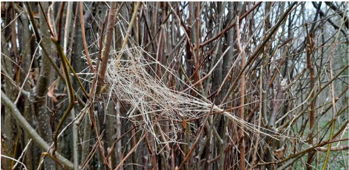
Impressionen aus dem Landschaftspark Semlow, Fotos: Karen Bahls