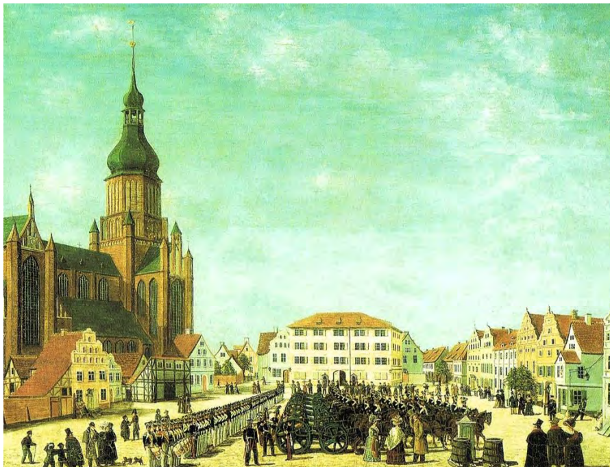
Neuer Markt, Ölbild eines unbekanntem Künstlers, Mitte 19. Jahrhundert, Stralsund Museum