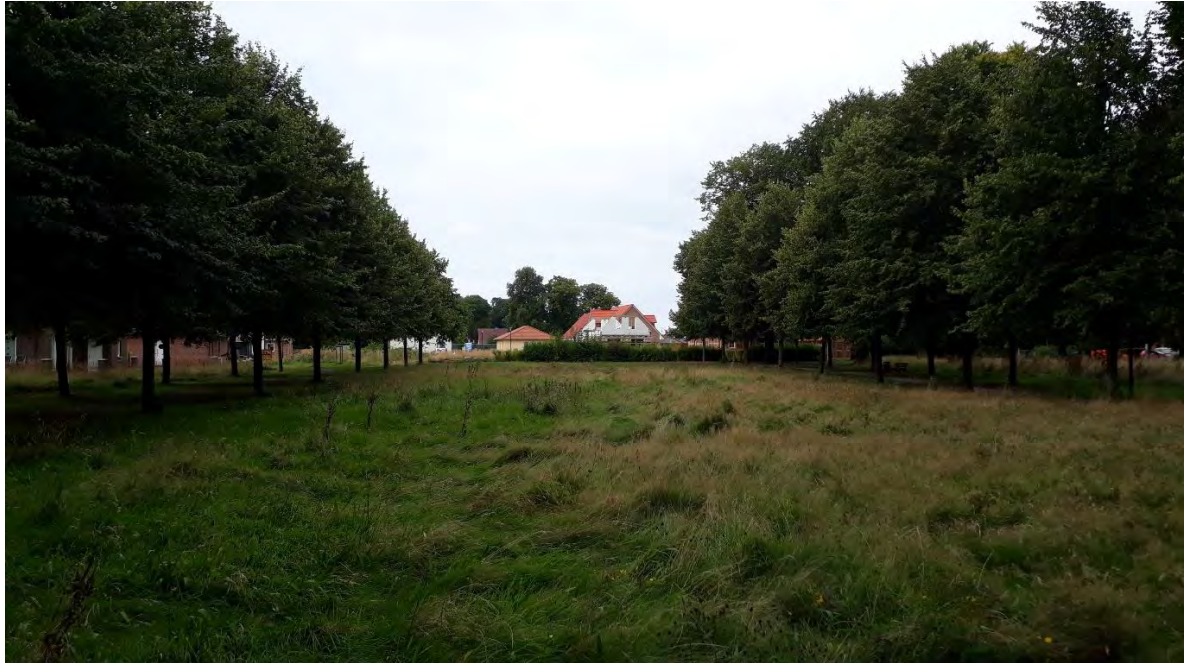
Ferienhaussiedlung am Standort des ehemaligen Herrenhauses, Foto: Angela Pfennig

Zum Abschluss fanden sich die Teilnehmer bei Kaffee und Kuchen – danke an die Freunde des Spalierobstgartens – zum anregenden Austausch zusammen.