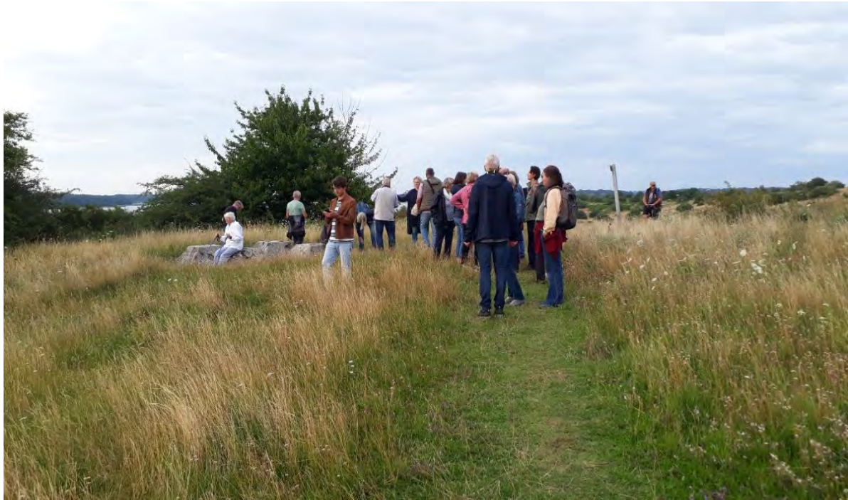
Impression von der Abendwanderung über die Halbinsel Devin, Foto: Angela Pfennig

In andächtiger Stille und tief beseelt von den leuchtenden Farben des Abendhimmels verließen wir die Halbinsel Devin. Ein friedlicher Abschied von diesem Ort.