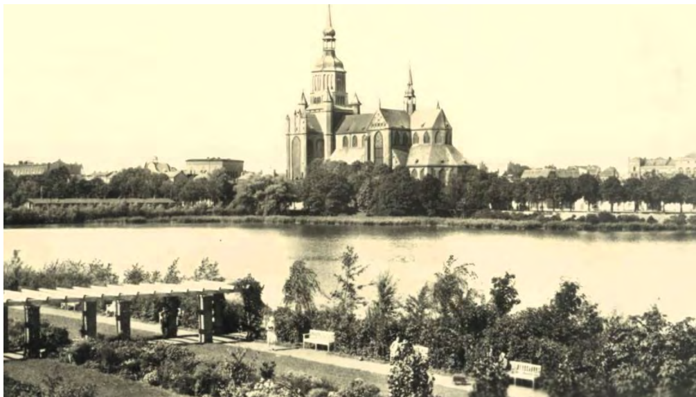
Hans-Lucht-Garten, um 1942, Postkarte