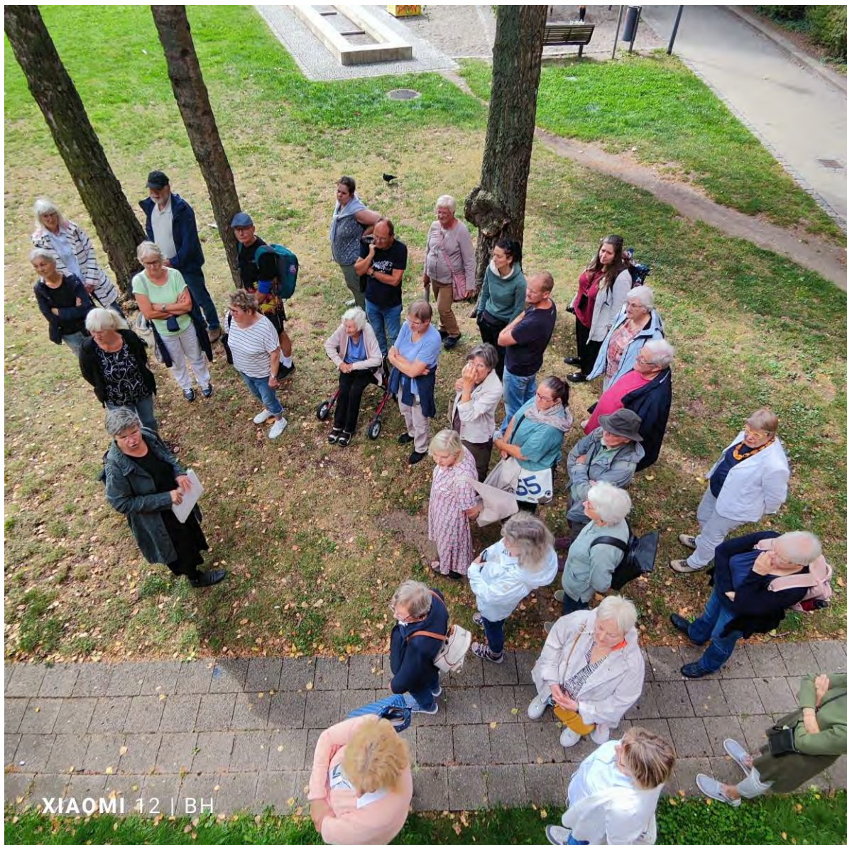
Auf dem Spielplatz am STALU

Gemeinsam mit dem in der Mitte des 14. Jahrhunderts entstandenen Küster- und Kantorenhaus, das auch als Latein-Schule für St. Nikolai genutzt wurde, diente der winzige, von einer Backsteinmauer umgebene mittelalterliche Hofgarten auf dem St. Nikolaikirchhof 2 als Teil der Kirchhofbegrenzung zur Bechermacherstraße. Um 1997 wurde er durch Landschaftsarchitektin Silke van Ackeren neugestaltet. Goldregen, Kletterhortensie und Efeu umspielen heute die Gartenmauer.