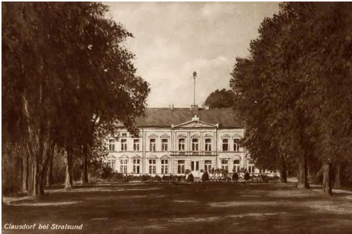
Clausdorf bei Stralsund Herrenhaus Klausdorf, Postkarte um 1920