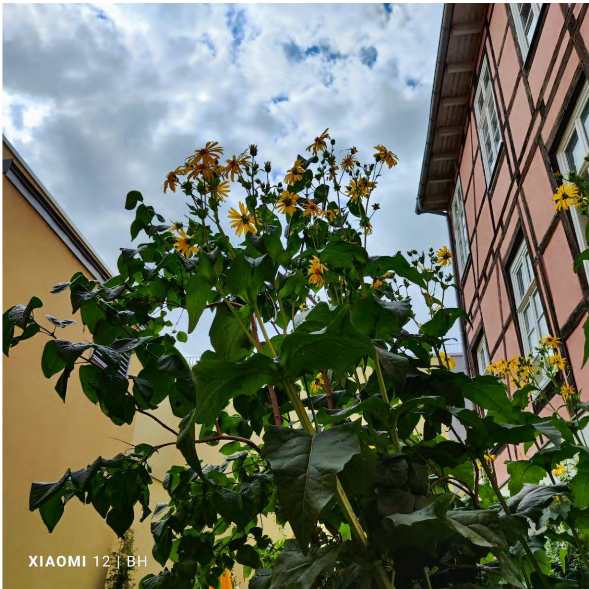
Staudenbeet auf dem Hof der Goldschmiede Stabenow

Im Zusammenhang mit der Bebauung des Quartiers 17 entstand 2012 im Innenbereich des Wohn- und Geschäftshauskomplexes eine öffentlich zugängliche Dachterrasse. Die extensive Dachbegrünung und Gruppen von Zieräpfeln in Hochbeeten bieten einen ästhetisch ansprechenden und stadtklimatisch bedeutsamen Freiraum in der hoch verdichteten Altstadt. Er löste unterschiedliche Empfindungen bei den Besuchern aus. Einige nahmen ein wertvolles Biotop wahr, anderen fehlte die Aufenthaltsqualität und die Pflege.