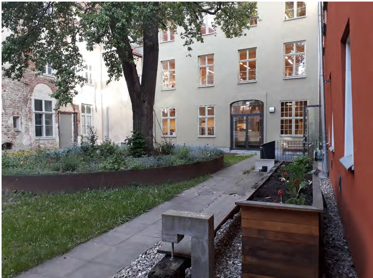
Hof der Stadtbibliothek

Der Rosengarten wird in zahlreichen zeitgenössischen Darstellungen als einer der schönsten und malerischsten Plätze der Stadt beschrieben. Anknüpfend an den Vorkriegszustand erfuhr er nach seiner Zerstörung im Zweiten Weltkrieg 1955 nach Entwürfen von Hartmut Olejnik eine Renaissance. Derzeit bemüht sich besonders das Bürgerkomitee „Rettet die Altstadt“ e.V. um die öffentliche Zugänglichkeit des lange Zeit geschlossenen Rosengartens.