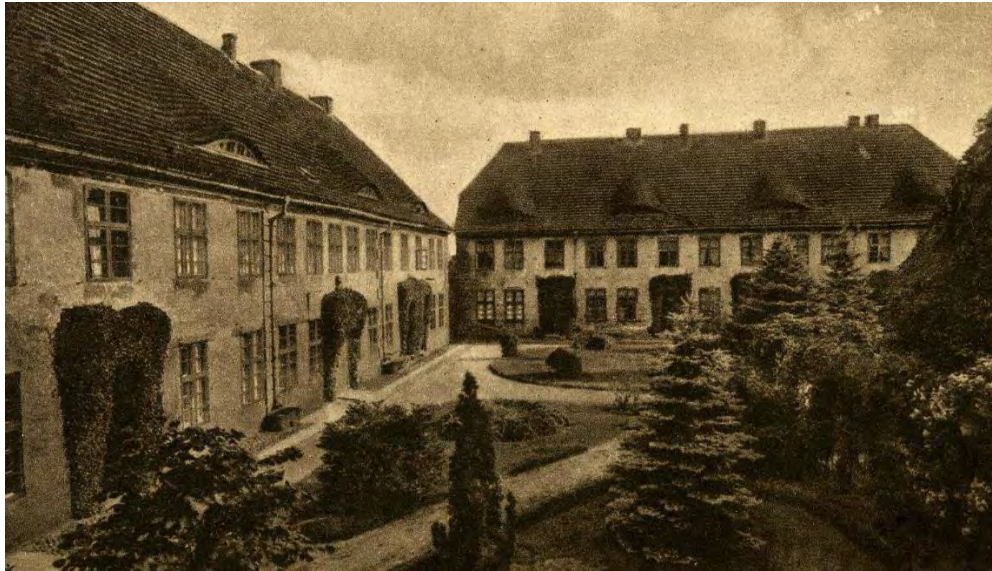
Klosterhof Bergen, Postkarte um 1925