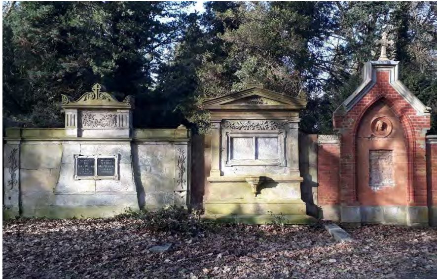
Grabmalmauer auf dem St.-Jürgen-Friedhof, Foto: Angela Pfennig