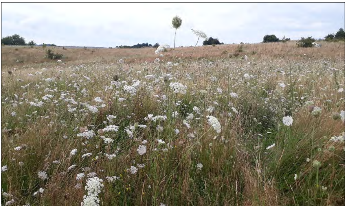
Wilde Möhre auf der Halbinsel Devin

Die Wilde Möhre dominierte das Landschaftsbild. Alle Phasen der Blüten- und Fruchtbildung konnten wahrgenommen werden. Der Wandel der offenen Blüten- dolde zur geschlossenen Vogelnestform der Fruchtdolde faszinierte besonders. Die Wilde Möhre wird auch als homöopathisches Arzneimittel verwendet: Die heutige Zeit ist gekennzeichnet durch eine kaum zu bewältigende Vielfalt und Komplexität von Einflüssen, die auf den Menschen einwirken und seine Aufmerksamkeit erfordern. Dies kann je nach Konstitution und Intensität der Belastung zu einer inneren Zerrissenheit und Unausgeglichenheit der Kräfte führen. Die Bewusstseinskräfte werden zerstreut und geschwächt. Dabei ist es oft nicht mehr möglich, die Energie auf das Wesentliche, auf das Zentrum zu lenken. Zerfahrenheit, Konzentrationsmangel, ein leerer Kopf, Benommenheit, sich im Kreis drehende Gedanken, Schwindelgefühle, Mangel an Entschlussfähigkeit und Antriebskraft, psychische Verstimmungszustände oder Schweißausbrüche können die Folgen sein. In solchen Situationen erweist sich die wilde Möhre als hilfreich. Sie vermag zerstreute Kräfte wieder auf den Mittelpunkt hinzuführen, den Blick für das Wesentliche zu schärfen, zu zentrieren.