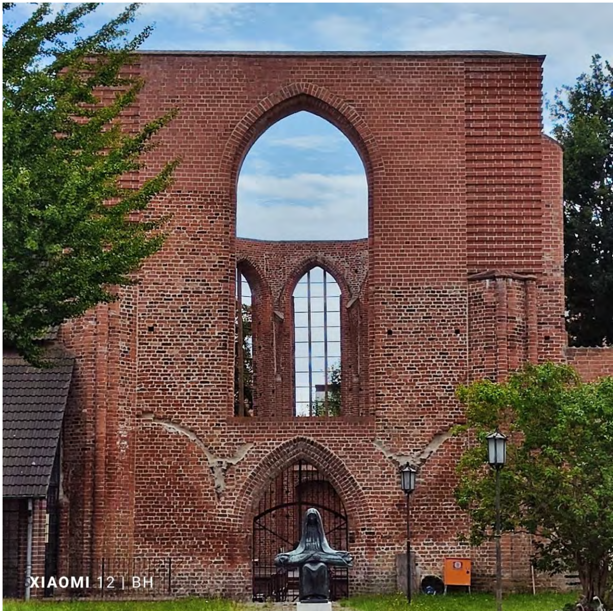
Kirchenschiffruine des Johannisklosters mit Pietà von Peter Jäger nach einem Entwurf von Hans Barlach

Spontan öffnete Frau Kummerow den von ihr und anderen Bewohnern der Badenstraße 1/2 zu einem kleinen Paradies umgestalteten, zuvor unattraktiven Hinterhof parallel zur Werkstatt der Goldschmiede Stabenow. Viele der heute dort blühenden Pflanzen – von der Felsenbirne über Bauernrosen bis hin zu Königskerzen und Wilder Karde – stammen aus Drigge und der Region Neuen- dorf/Griebenow. Dieses unvermittelte Eintauchen von der belebten Geschäftsstraße in einen ruhigen, üppig blühenden Garten ist für viele Besucher immer wieder sehr überraschend.