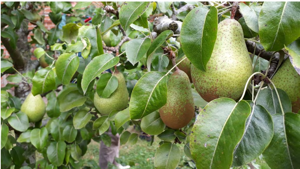
Spalierobstgarten Klausdorf, Foto: Angela Pfennig

Friedrich Hölderlin, aus: Hälfte des Lebens