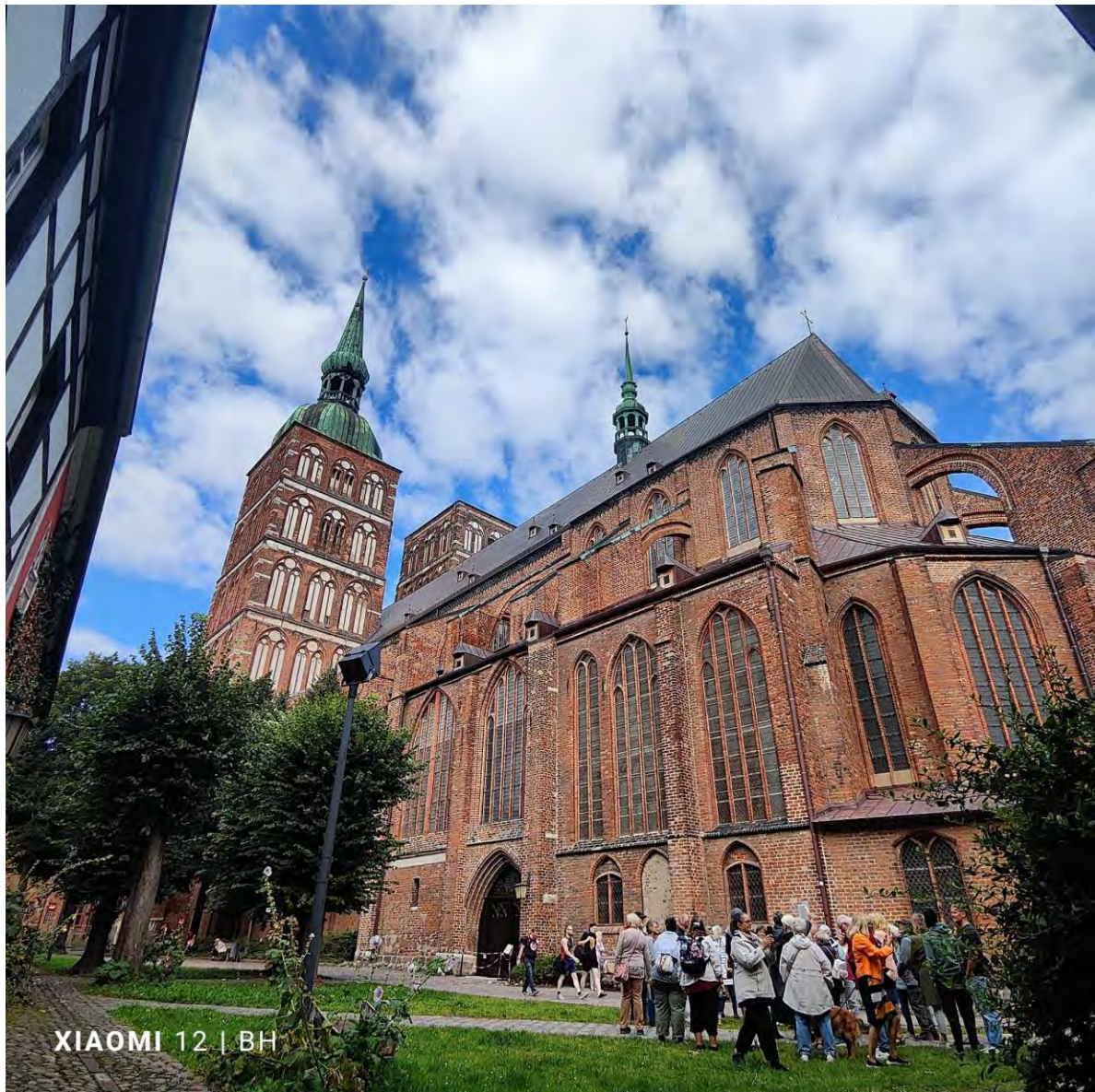
Der südliche Nikolaikirchhof

Ende des 19. Jahrhunderts war der Nikolaikirchhof als Begräbnisstätte endgültig aufgegeben worden. 1892 sahen nicht realisierte Planungen eine Freilegung der Nikolaikirche von der umgebenden Bebauung, deren maßstabs- und raumbildende Wirkung verkannt wurde, und die Gestaltung einer Gartenanlage im landschaftlichen Stil vor. Um 1900 wurde der südliche Nikolaikirchhof gärtnerisch gestaltet.