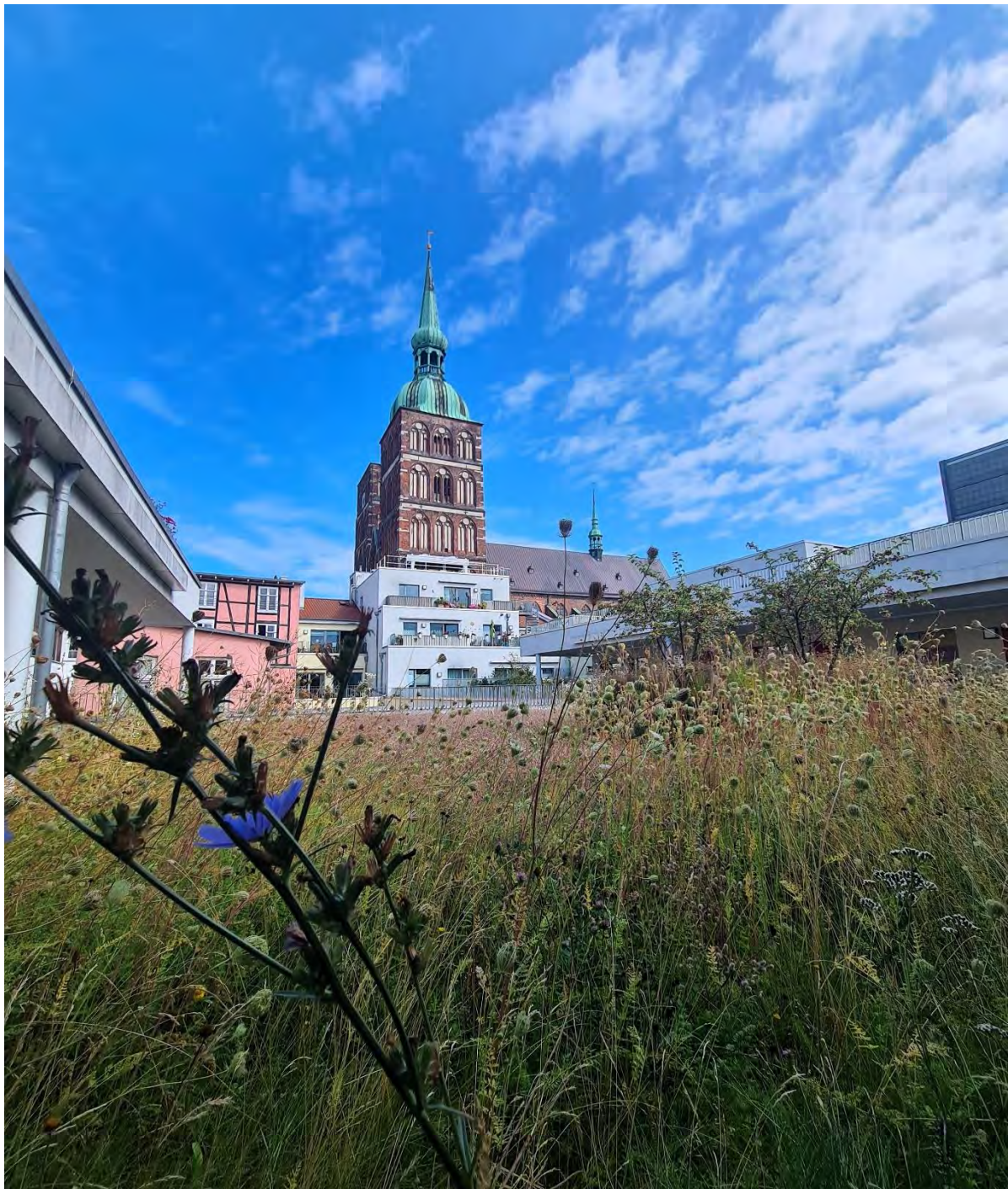
Dachterrasse auf dem Quartier 17, Foto: Janine Hahn

heute als herausragendes Beispiel der Nachkriegsmoderne in Stralsund gilt und dem Staatlichen Amt für Landwirtschaft und Umwelt Vorpommern als Bürogebäude dient. Der Leichtigkeit des Gebäudes entspricht auch die ursprüngliche Bepflanzung der Freifläche mit Birkengruppen, die dem Raum eine heitere Luftigkeit und Transparenz verleiht. Am 10. September 2006 wurde ein Spielplatz mit außergewöhnlichen, futuristisch anmutenden Spielgeräten mit einem kleinen Kinderfest übergeben. Das Wasserspiel lockt im Sommer viele Kinder zum Planschen an. Entlang der Heilgeiststraße bezaubert ein als Block gepflanzter Baumhain mit Felsenbirnen zu jeder Jahreszeit.