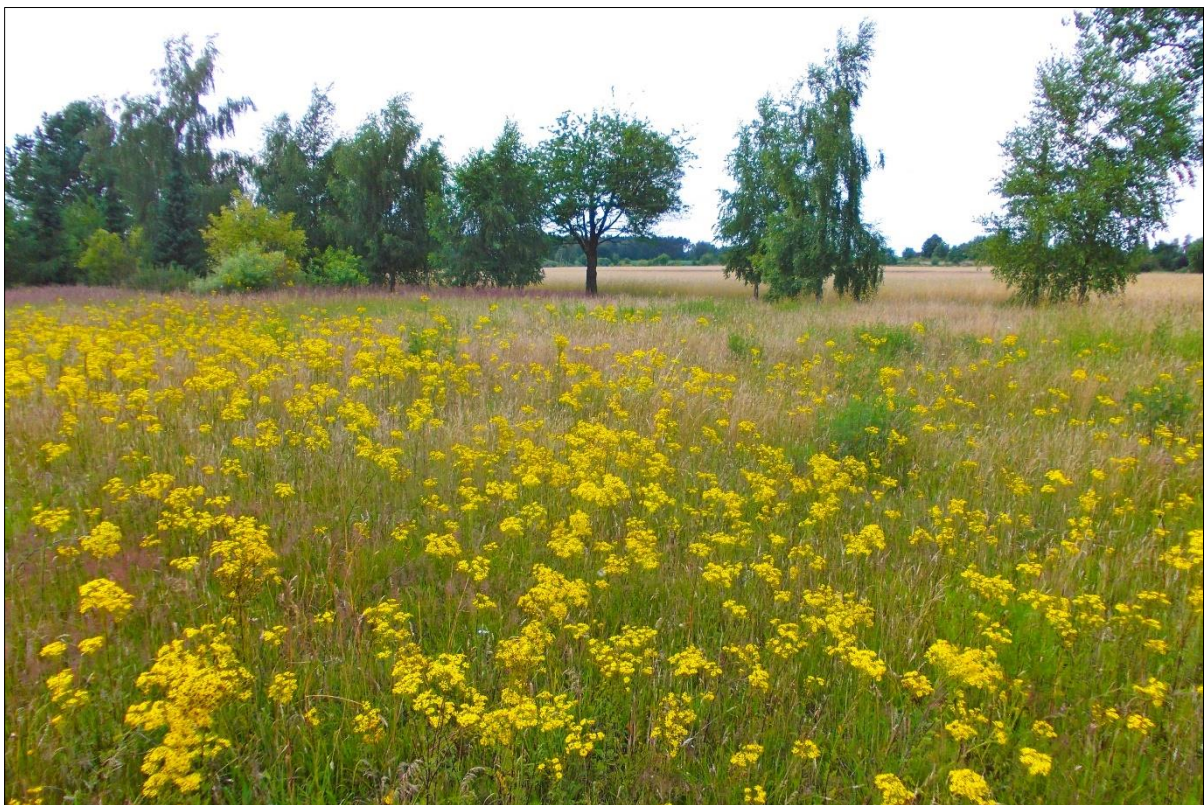
Wiese mit Jakobskreuzkraut