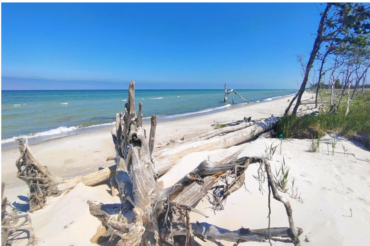
Blick auf den Strand des Nordteils des renaturierten Ostzingst in der Kernzone des Nationalparks „Vorpommersche Boddenlandschaft“

6. Februar Martin Jeschke | Stralsund Renaturierung. Wiederherstellung von naturnahen Lebensräumen am Beispiel des Ostzingst | Sundische Wiese Vortrag 17.30 Uhr | Stralsund, Wasserstraße 16 Eintritt: 9 Euro