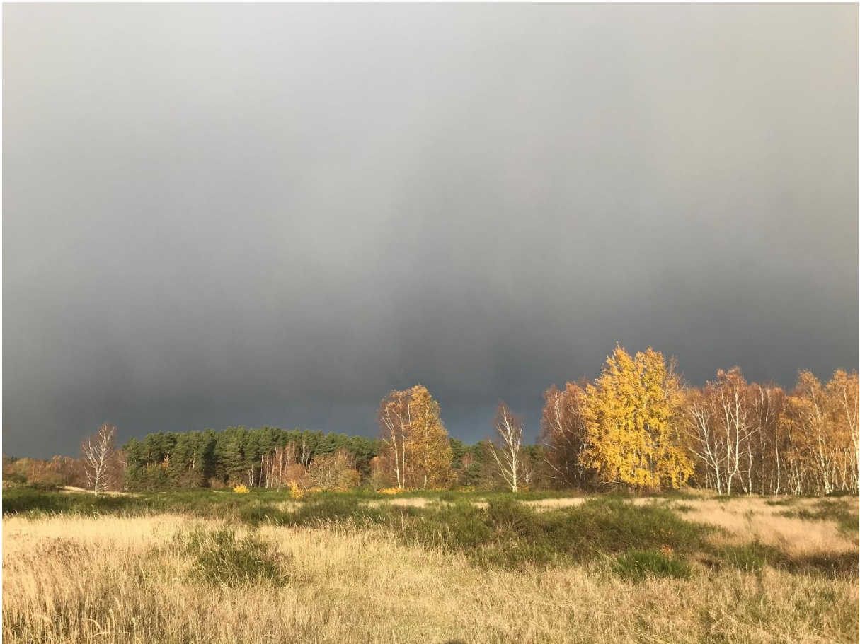
Försterhofer Heide