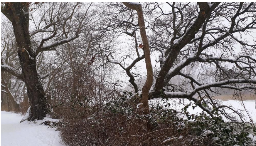
Naturschutzlehrpfad am Moorteich