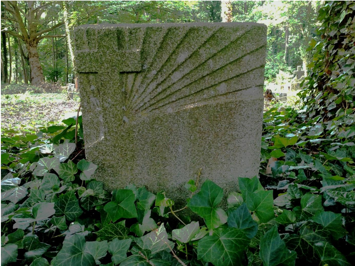
Grabstätten auf dem Neuen Frankenfriedhof

Bitte informieren Sie sich über die Veranstaltungen auch unter http://www.stralsunder-akademie.de/aktuell.html