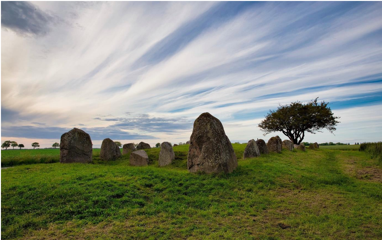
Hünenbett Nobbín auf Rügen, Foto: Guntram Stoehr

Vorträge – Wiederherstellung von naturnahen Lebensräumen am Beispiel des Ostzingst und der Sundischen Wiese, Symbolpflanzen – Pflanzensymbolik | Die biblische Garten- und Pflanzenwelt in Schrift, Kunst und Architektur, Soziale Landwirtschaft im Gefängnis – Perspektiven sozialer und ökologischer Inklusion, Kraftort Megalithen sowie landwirtschaftliche Forschung und Praxis der SS in Konzentrationslagern und eroberten Gebieten bieten vielfältige thematische Anregungen für Gespräche über Garten- und Landschaftskultur.