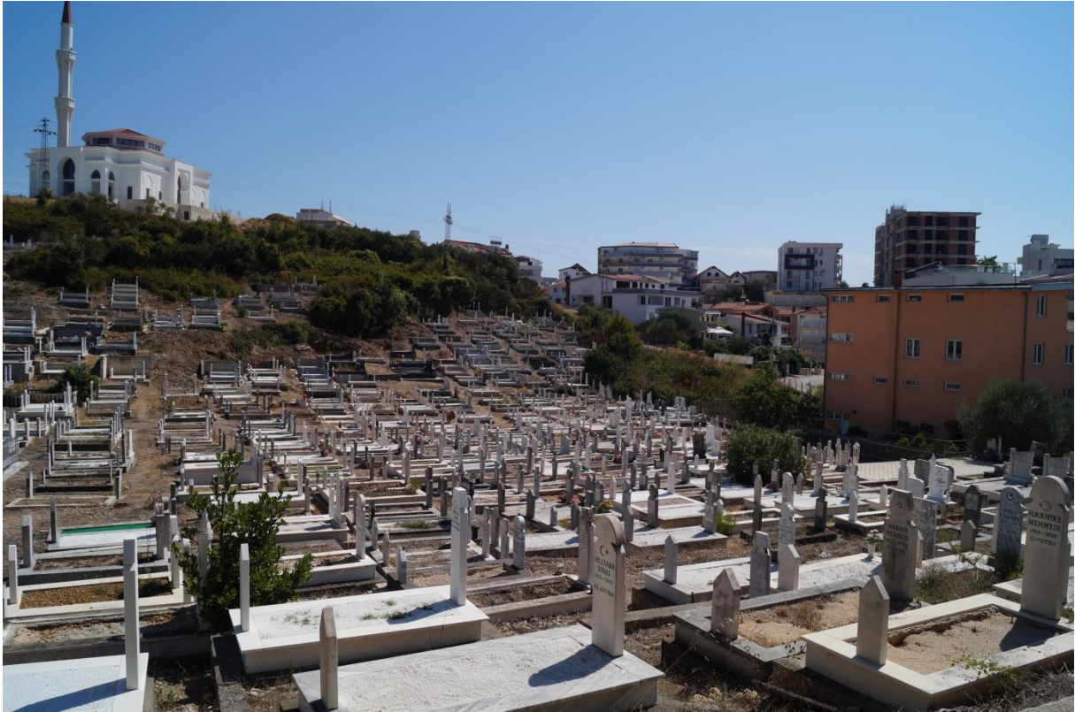
Muslimischer Friedhof Ulcinj / Montenegro