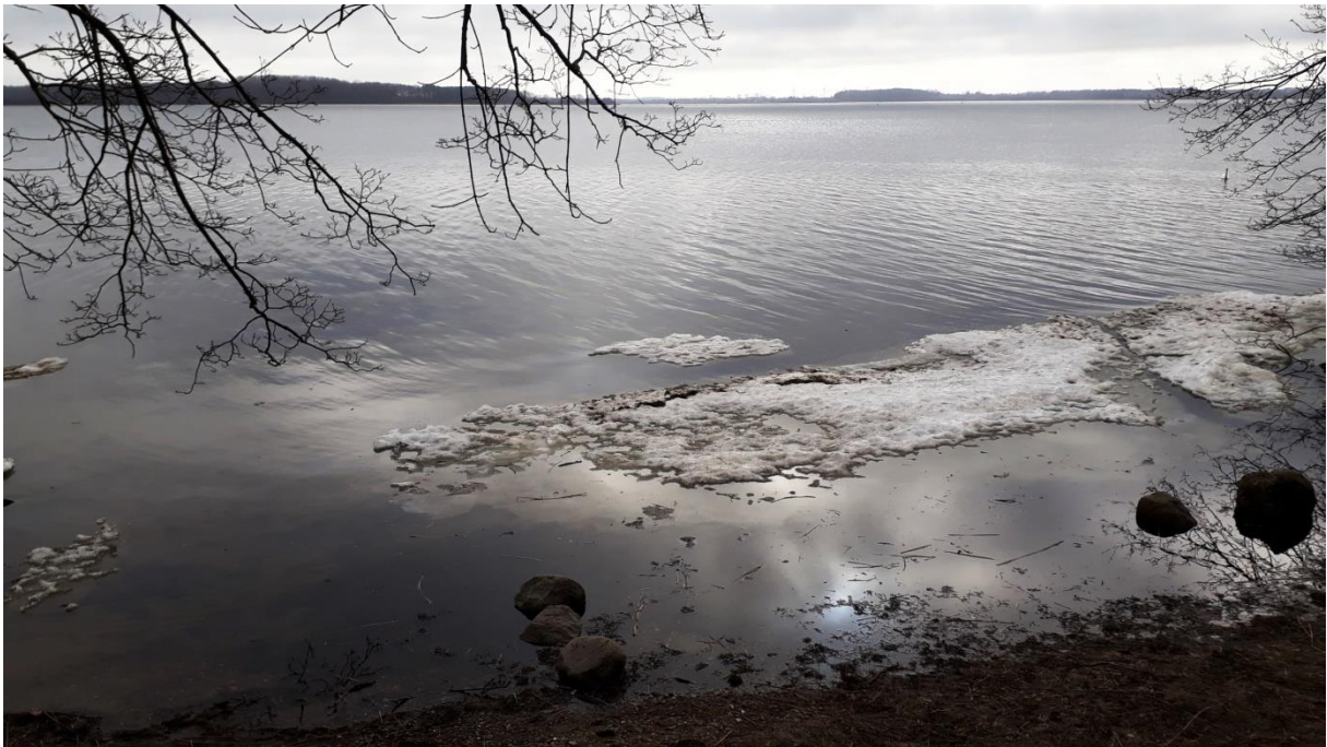
Sund-Landschaft auf der Insel Dänholm