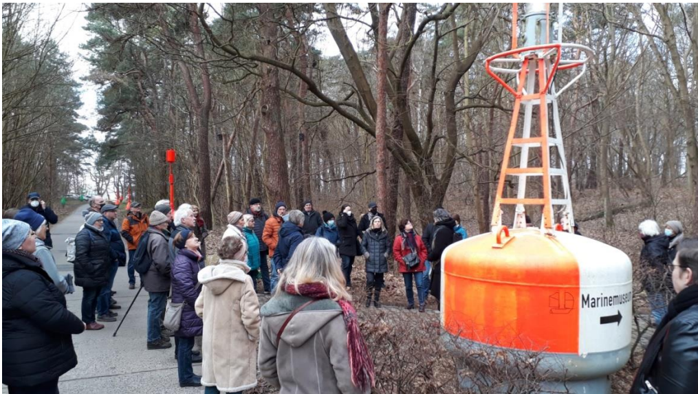
An der Sternschanze