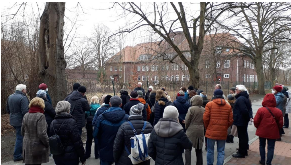
Am ehemaligen Exerzierplatz