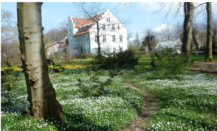
Vorfrühling im Park Streu

Diese Führung war ursprünglich für den 20. März vorgesehen und wird auf den 25. April verschoben.