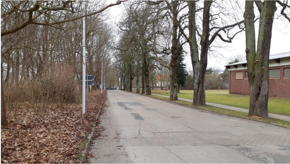
Allee entlang einer historischen Wegeverbindung zur ehemaligen Fähre