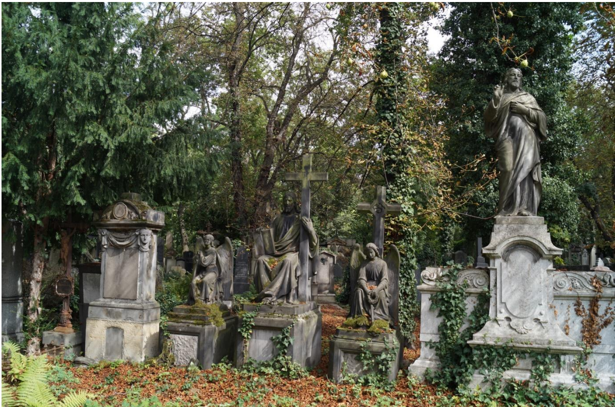
Zentralfriedhof Prag

Im anschließenden Gespräch beantwortete Martin Jeschke Fragen zur Entwicklung des Stralsunder Zentralfriedhofs und zu Tendenzen in der Friedhofskultur allgemein. Die Einzigartigkeit deutscher Friedhofskultur ist von enormen gesellschaftlichen Veränderungen betroffen. Der klassische Friedhof ist nicht mehr alleiniger Ort für die Beisetzung, da immer mehr Menschen nach Alternativen zu den traditionellen Familiengrabstätten suchen, in Stralsund besonders durch die Seebestattung. Familiengrabstätten über mehrere Generationen, wie sie an einigen Beispielen eindrucksvoll im Vortrag gezeigt wurden, haben keine Zukunft mehr.