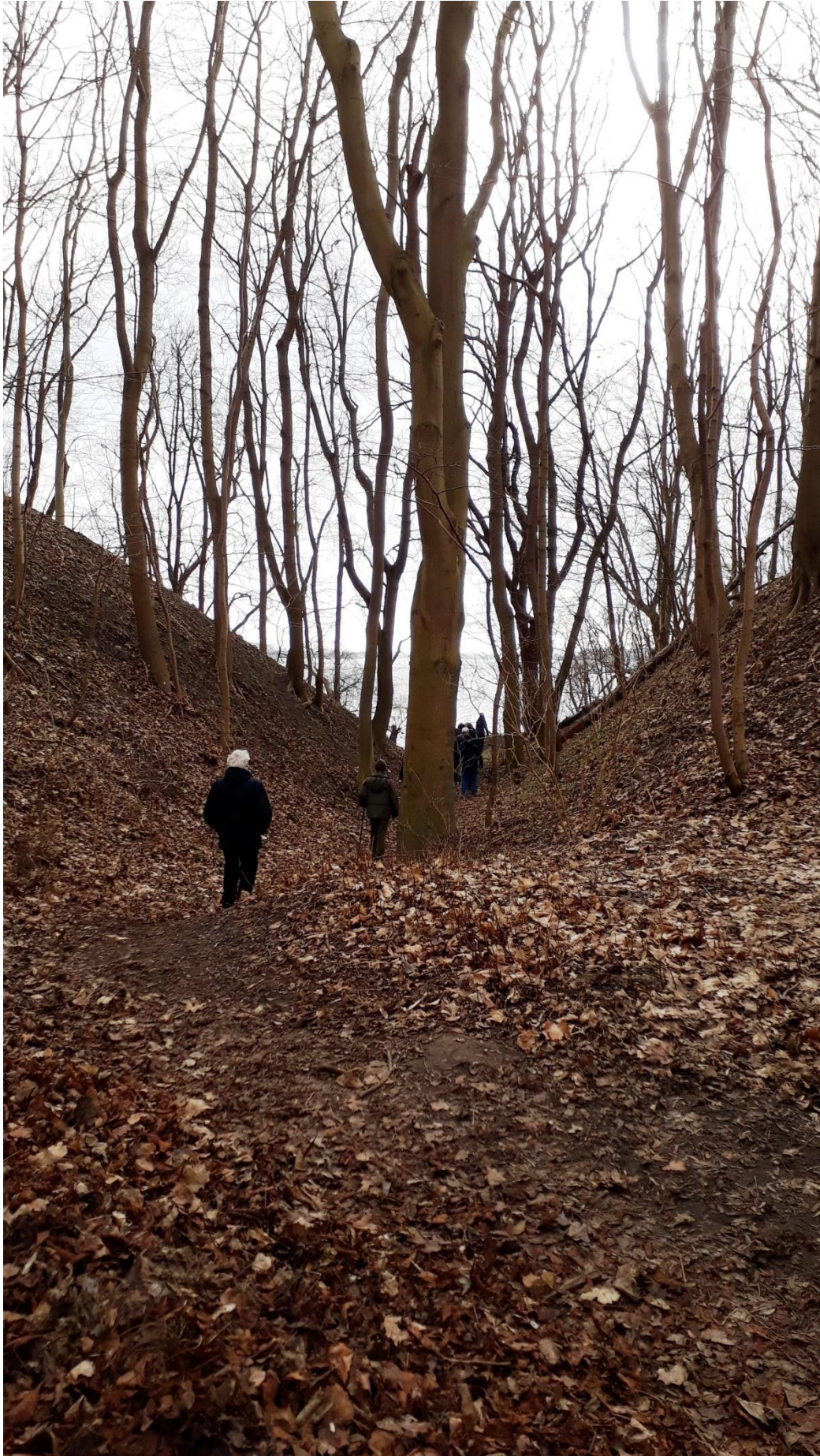
In den südlichen Wallanlagen, Foto: Georg Pfennig