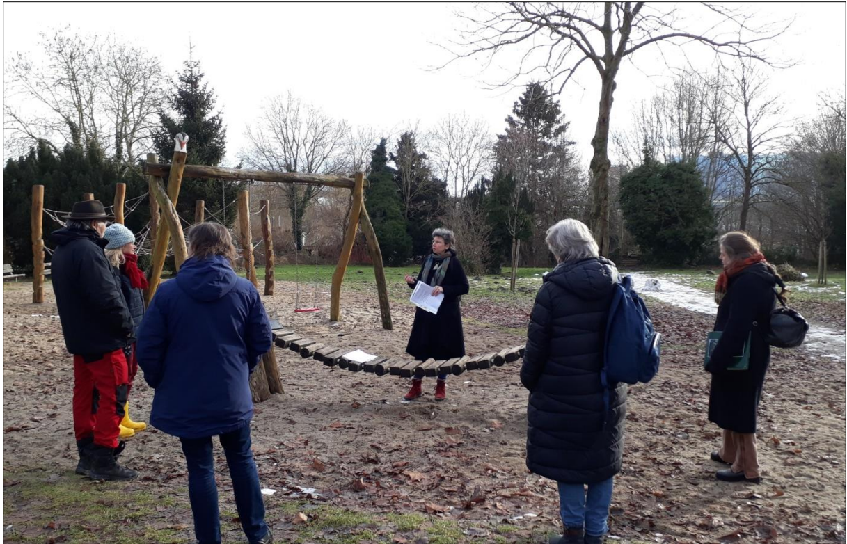
Auf dem Alten Frankenfriedhof