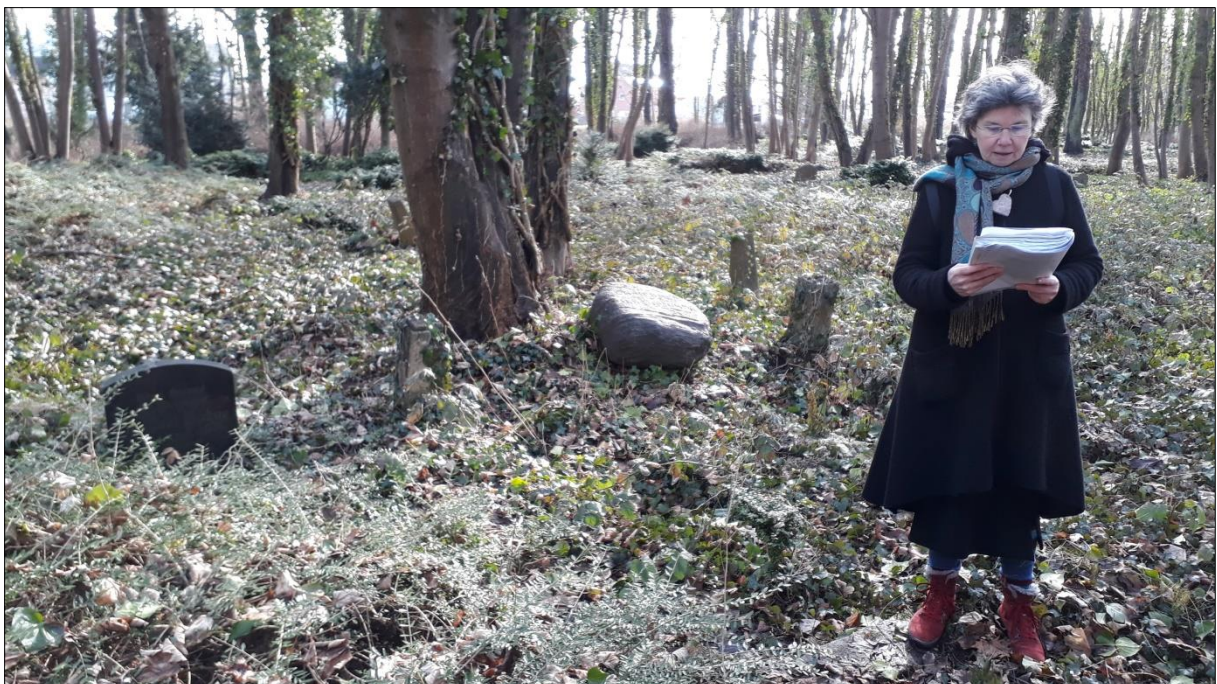
Am Grab von Carl Friedrich Pogge, Foto: Christine Schönfeldt

Das aufmerksame Publikum empfing einige Impulse zum Nachdenken über sichtbar gewordene geschichtliche und kulturelle Zusammenhänge, unter anderem zu bisher öffentlich wenig beachteten Themen wie Zwangsarbeit in Stralsund während der Zeit des Nationalsozialismus und der nicht mehr erhaltene Ehrenfriedhof für Gefallene des Ersten Weltkriegs sowie zum Wohnort von Karl Lappe in Pütte.