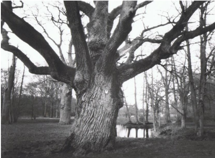
Eiche im Park Schlemmin, Camera obscura, Volkmar Herre