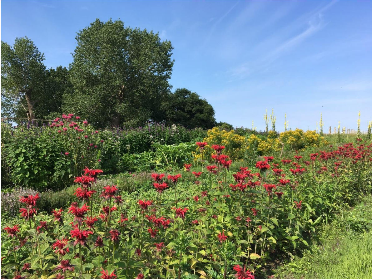
Indianernessel und Johanniskraut, Sommer 2020

Zusätzlich in das Jahresprogramm aufgenommen wurde eine Führung am 25. Juli, 10.00 Uhr. Dr. Anke Braumann wird durch ihre nach biologisch-dynamischen Richtlinien bewirtschaftete Kräuterplantage in Dreschwitz auf Rügen führen.