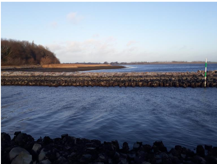
Ostansteuerung Dänholm