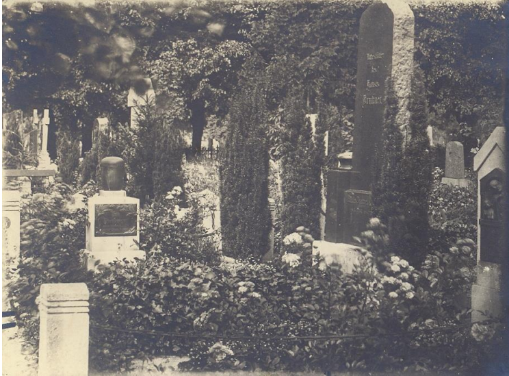
Neuer Frankenfriedhof, um 1920