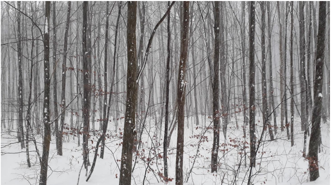
Stralsunder Stadtwald