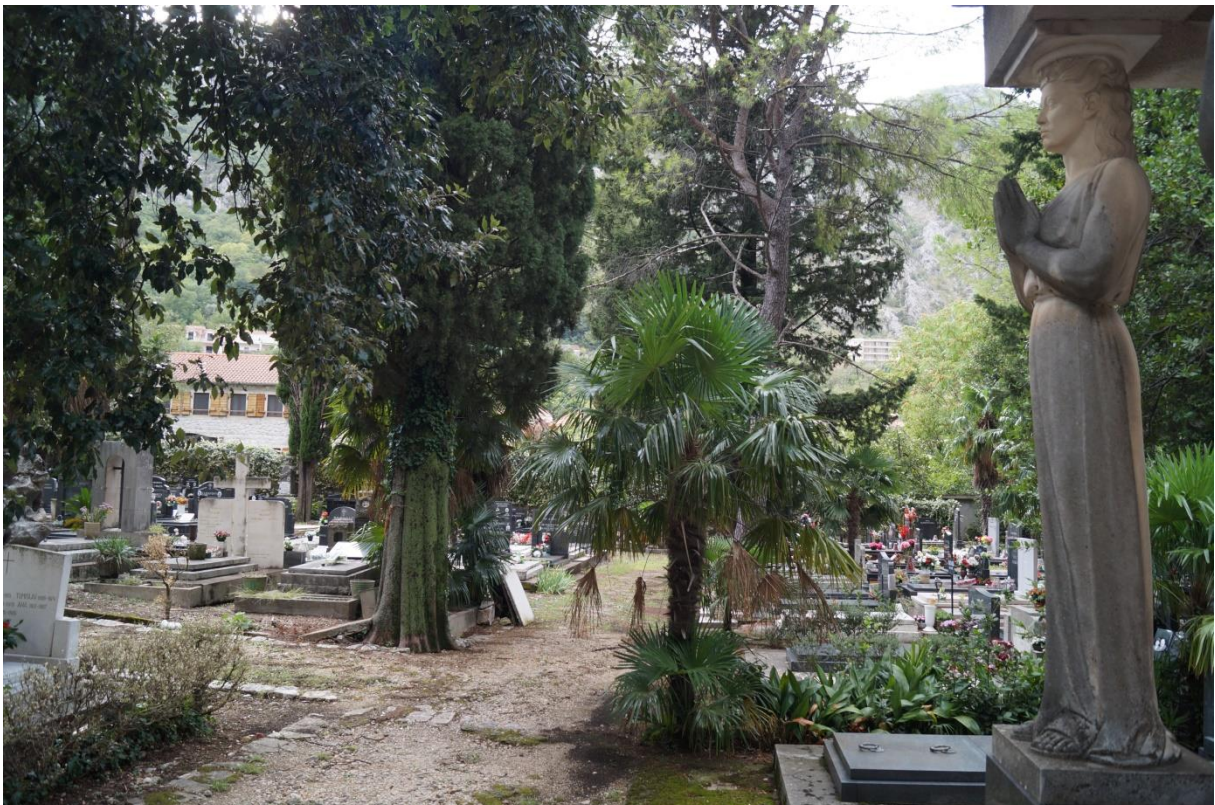
Hauptfriedhof der Stadt Kotor in Montenegro

8. März Nekropolen & Dorffriedhöfe in Osteuropa und auf dem Balkan Vortrag Martin Jeschke 17.30 Uhr | Stralsund, Festsaal Wulflamhaus, Alter Markt 5 Eintritt: 9 Euro