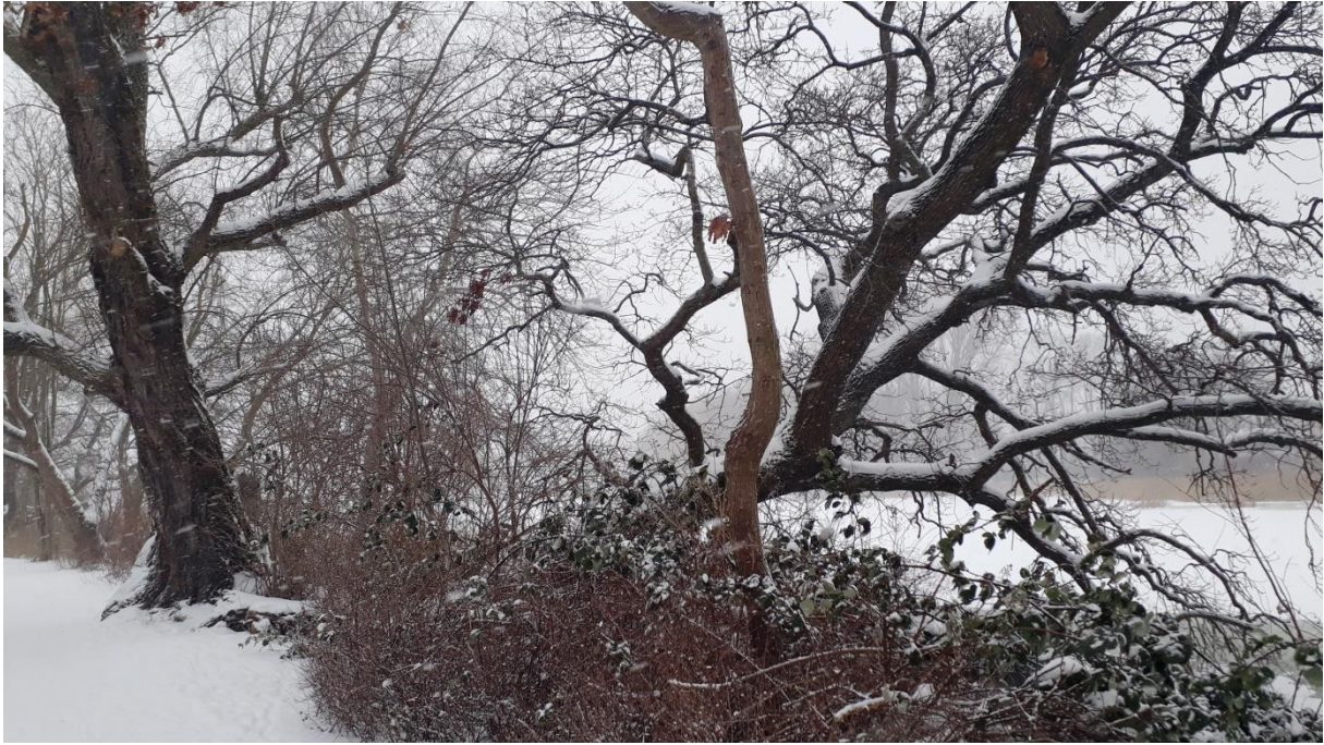
Dendrologischer Lehrpfad am Moorteich, Foto: Angela Pfennig