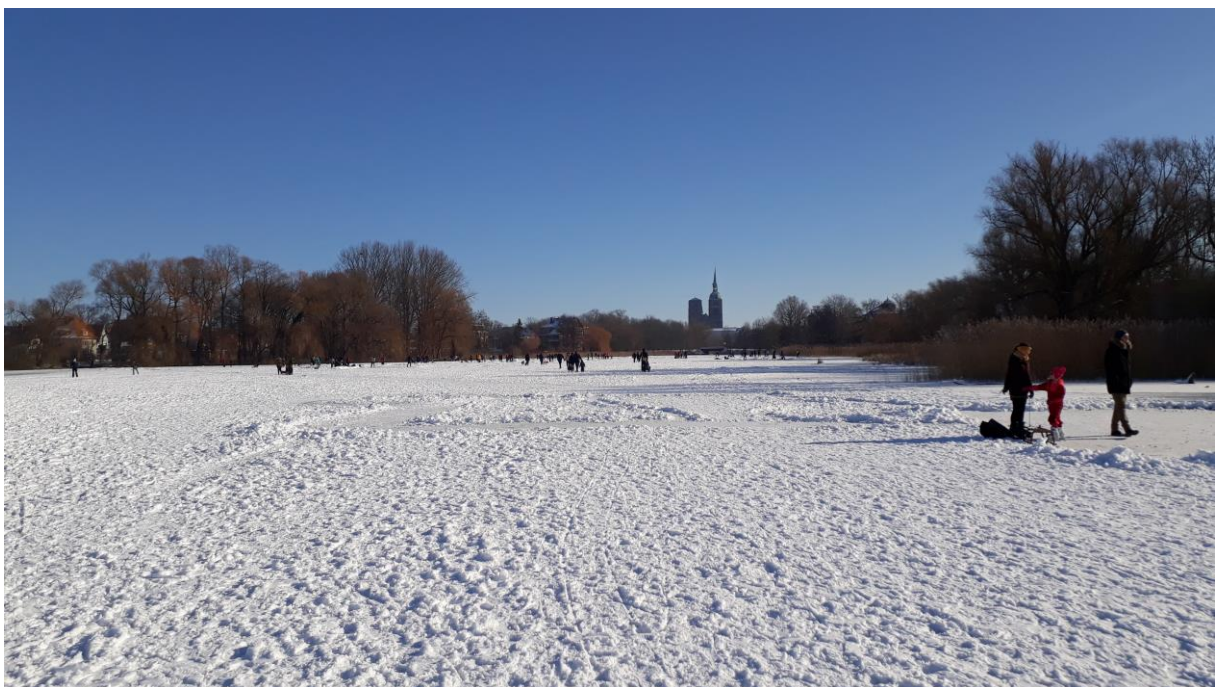
Auf dem Moorteich in Stralsund

wie tief berührend vermag eine Schneelandschaft auf die Seelen der Menschen zu wirken. Seit Tagen strömen Hunderte mit Schneeschiebern, Besen, Campingstühlen und Schlitten auf die große weiße Eisfläche des Moorteiches am Stadtwald und beginnen sie zu gestalten mit Wegen, Eislaufbahnen, Spielfeldern und Schneeskulpturen. Die Szenerie gleicht den Wimmelbildern mit Winterlandschaften von Pieter Bruegel. Fröhlich, heiter, picknickend, Eishockey spielend, Schlittschuh und Ski laufend, mit Kind und Kegel und Hunden begegnen sich die Menschen nach monatelanger Isolation wieder frei im öffentlichen Raum und entdecken ihr soziales Wesen neu.