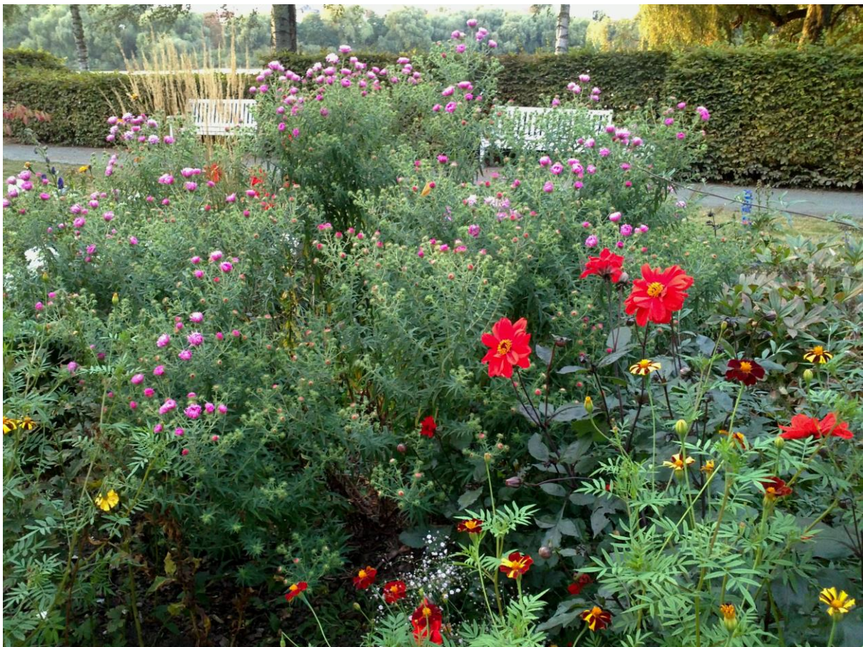
Staudengarten in der Parkanlage am Wulflamufer in Stralsund