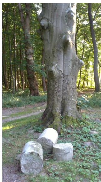
Partie am Apollotempel, Foto: Pfennig, 2015