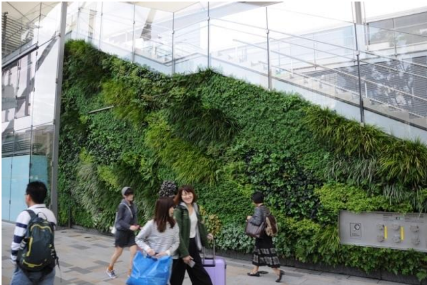
Fassadenbegrünung in Tokio, Foto: Daniel Kaiser, 2015