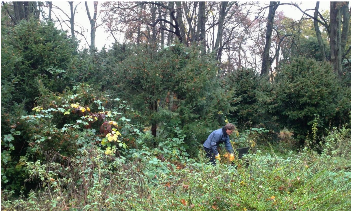
Pflegeeinsatz, Foto: Angela Pfennig, 2015

5. November 2016 | 10.00 Uhr – 14.00 Uhr | Stralsund, Treffpunkt: Eingang St.-Jürgen-Friedhof, Hainholzstraße