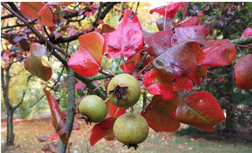
Pyrus boissieriana