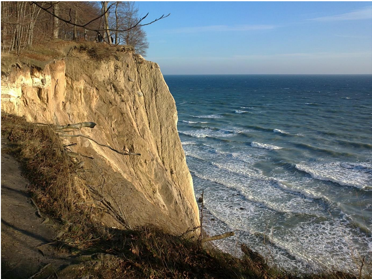
Kreideküste auf Rügen, Foto: Angela Pfennig