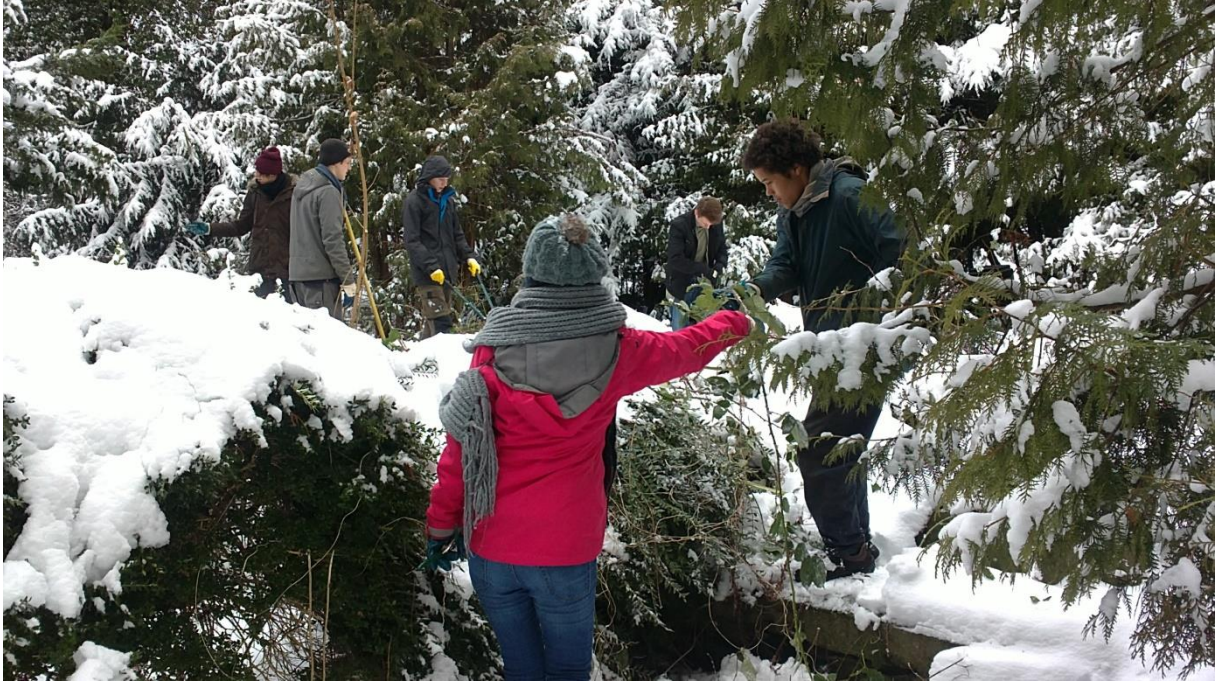
Pflegeeinsatz der Jugendbauhütte auf dem St.-Jürgen-Friedhof, Februar 2015, Foto: Angela Pfennig

27. Februar 2016 | 10.00-14.00 Uhr | Stralsund, Eingang Hainholzstraße St.-Jürgen-Friedhof Stralsund