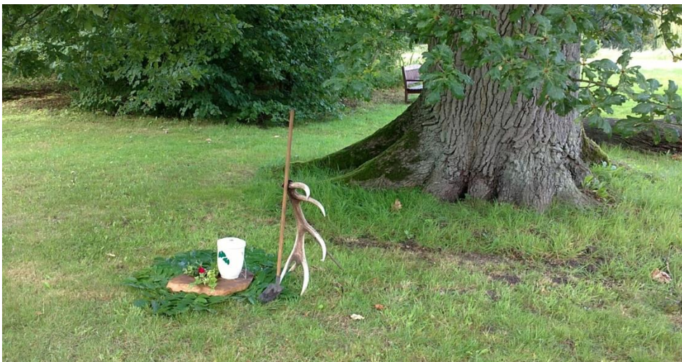
FriedWald Pansevitz