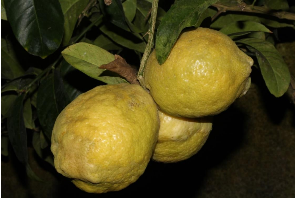
Citrus limon

21. Februar 2016 | 10.00 Uhr | Pansevitz auf Rügen, Eingang Herrenhaus-Ruine