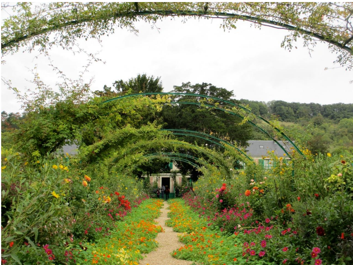
Garten von Claude Monet in Giverny, Foto: Kirsten Plathof 2015